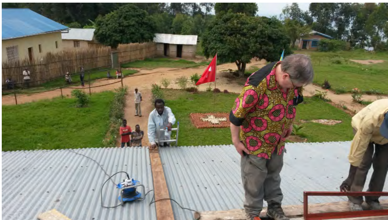
janvier 2015 : pose de capteurs solaires sur le toit de la bibliothèque