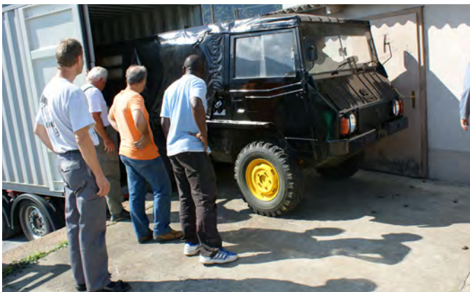
Août 2009, embarquement dans un container du véhicule donné par l'armée Suisse