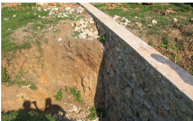
De solides fondations