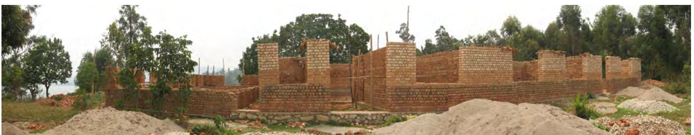
Vue panoramique du chantier en août 2010, avant la réalisation des chaînages