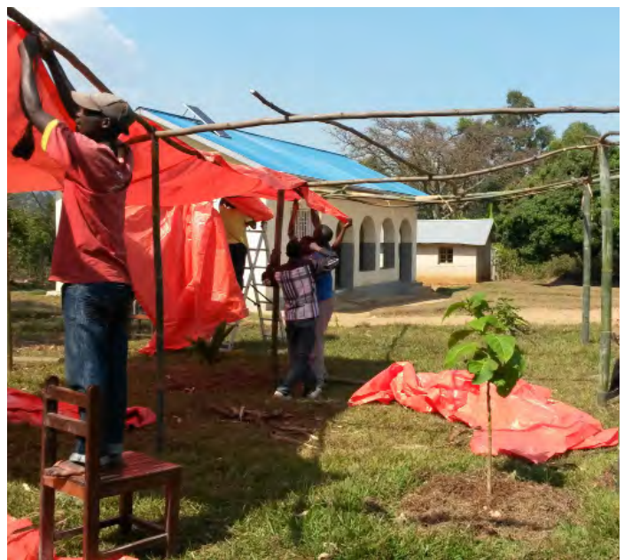
juillet 2014 : préparation de la fête de l'inauguration