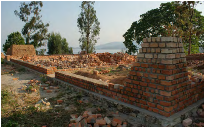
Août 2009, le bâtiment prend forme