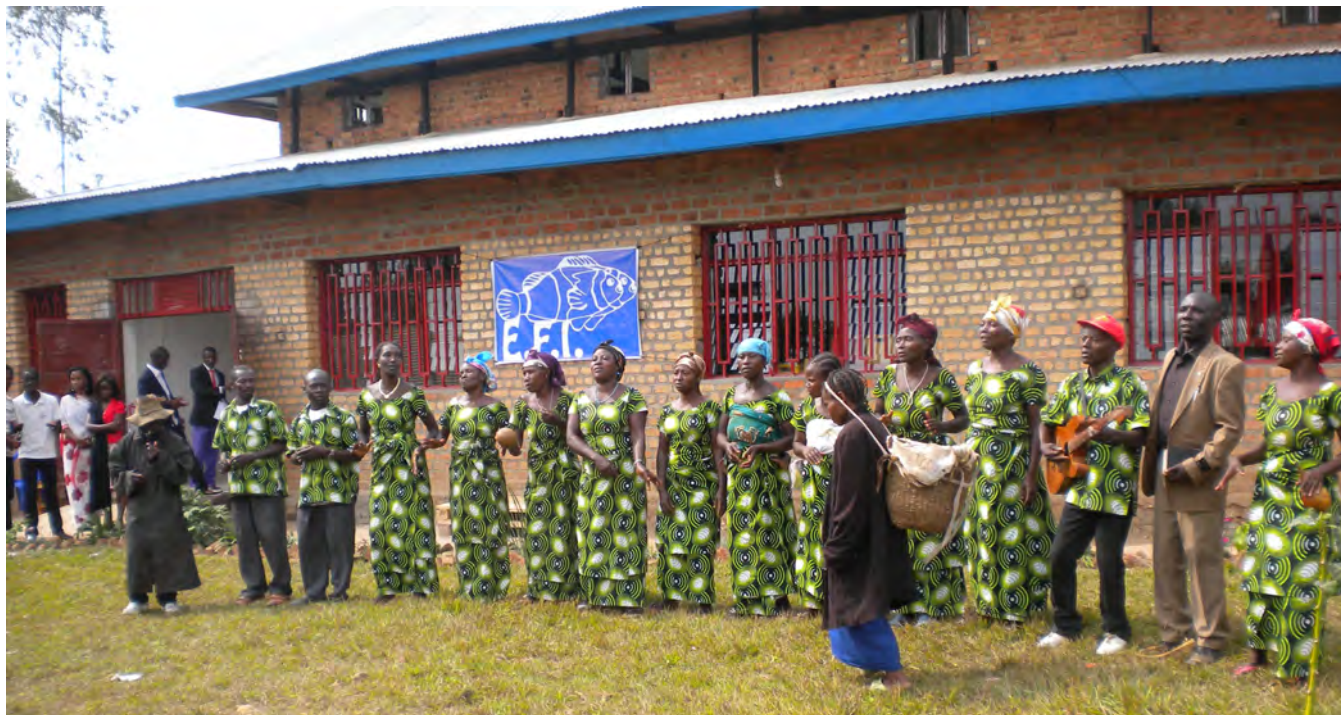
août 2014 : production d'un groupe de danses traditionnelles lors de l'inauguration