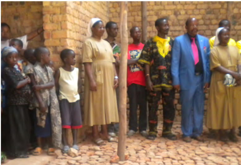
22 août 2012 : remise des prix du concours littéraire organisé par EFI