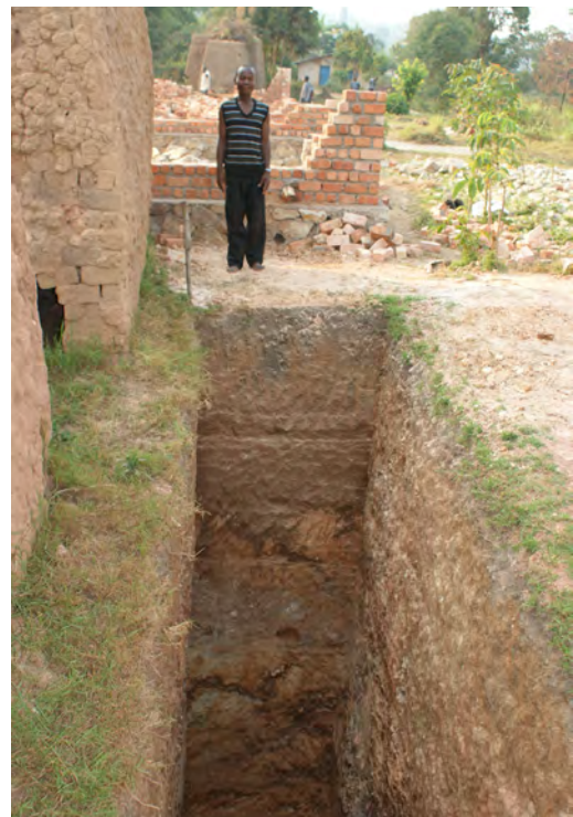
Août 2009, la fosse septique