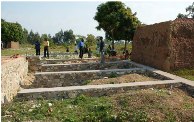
La surface du bâtiment est importante