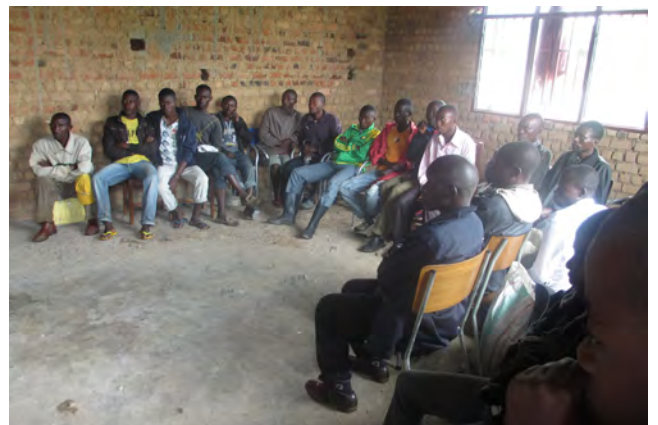
décembre 2013 : comités de préparation de l'inauguration et de l'exploitation