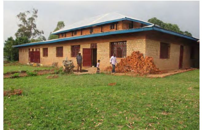
décembre 2013 : pose du carrelage et aménagement des extérieurs