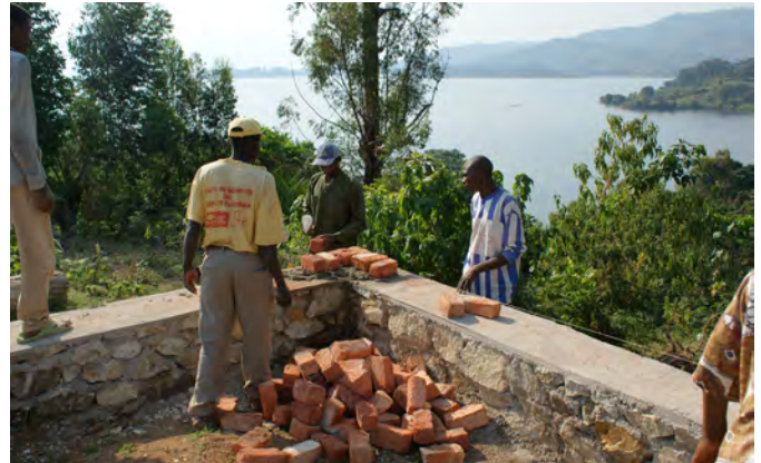
Un lieu de rêve