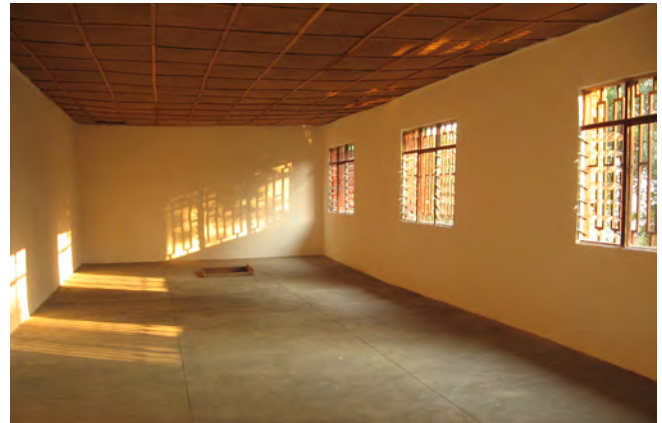
été 2013 : la bibliothèque avant les étagères