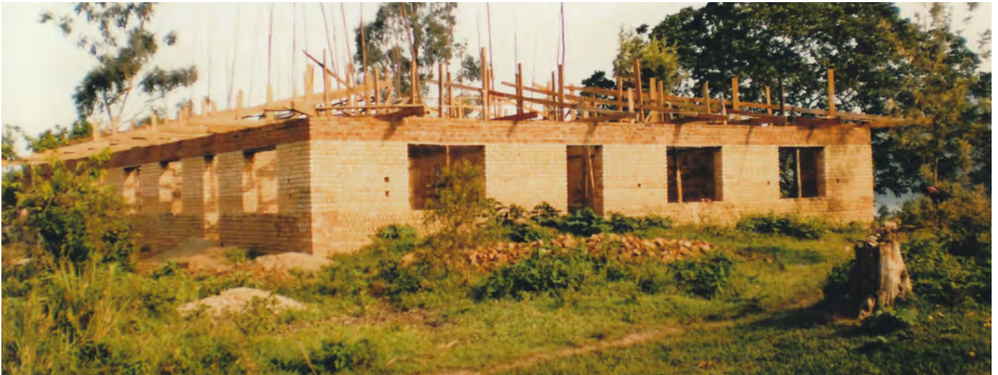
Novembre - décembre 2010, pose de la charpente