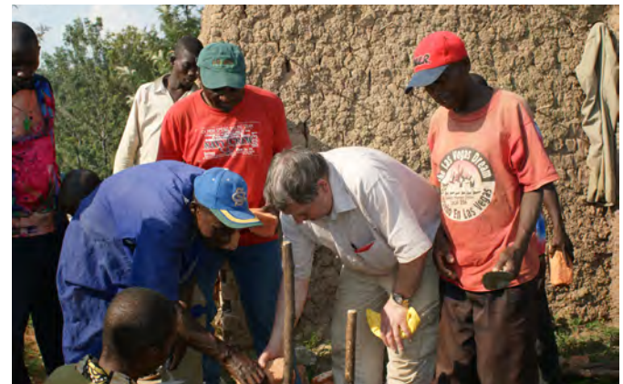
Juillet 2009, pose des premières briques