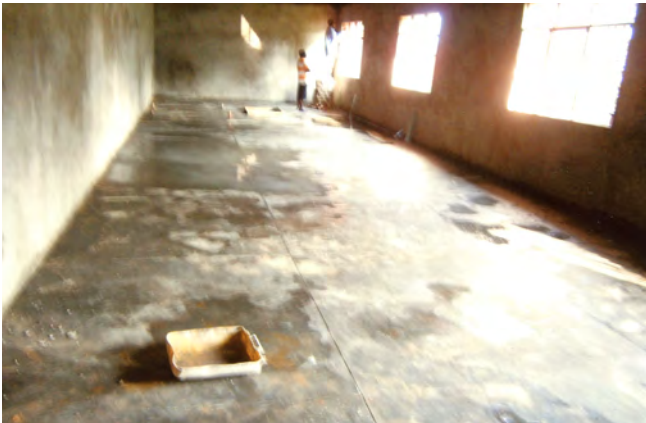
printemps 2013 : réalisation des sols en ciment