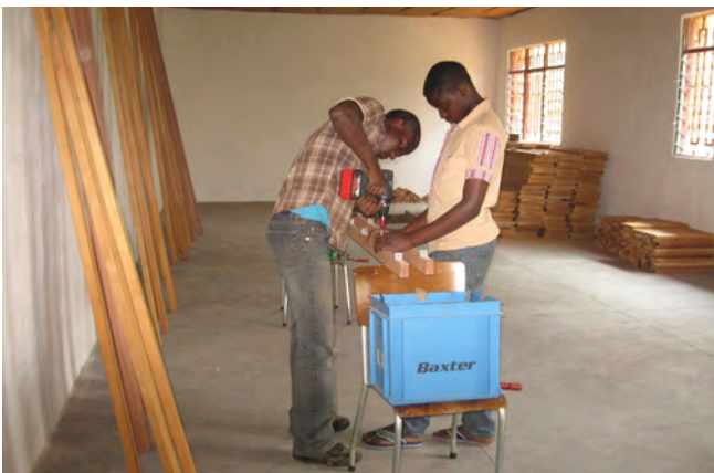
juillet 2013 : construction des étagères