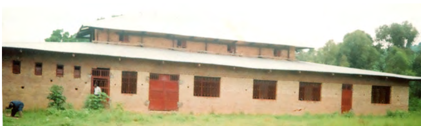
février 2013 : pose des portes et fenêtres