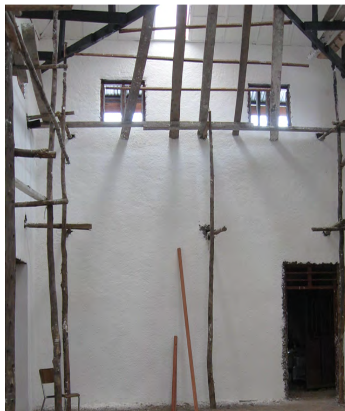
août 2013 : peinture des murs et réalisation du plafond de la salle de lecture