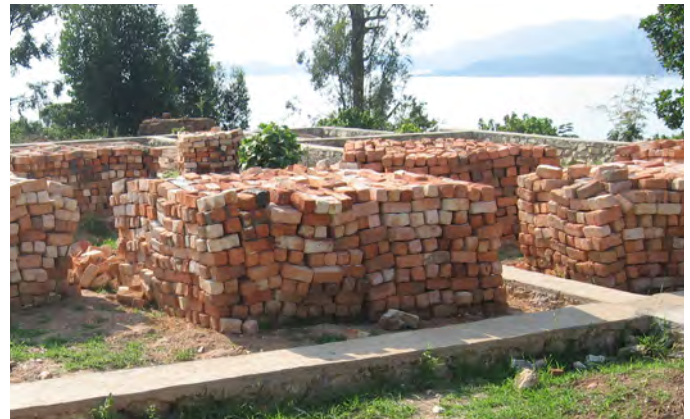
Des briques prêtes à l'emploi