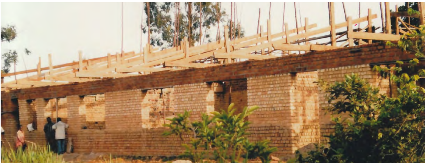
Novembre - décembre 2010, pose de la charpente