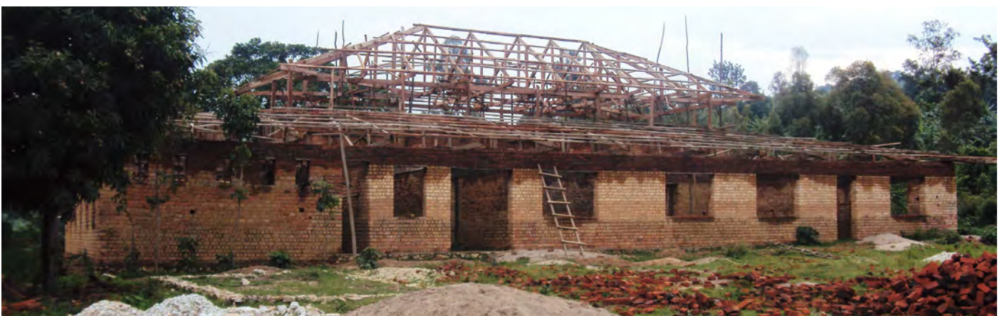
Novembre - décembre 2010, pose de la charpente