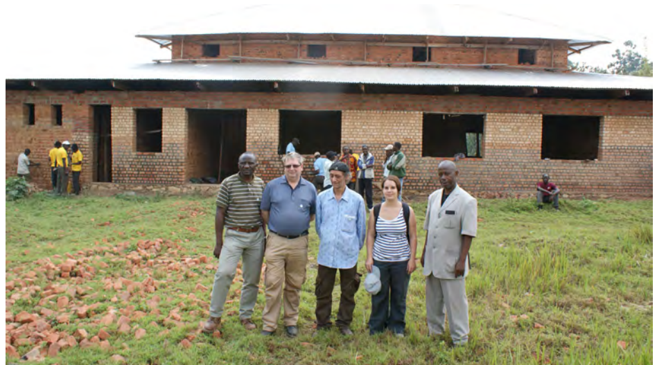
Juillet 2011 : premier voyage de rencontres et d'échange