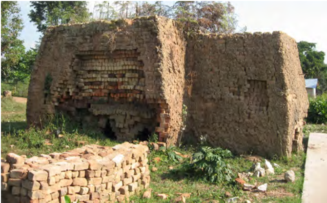
Juillet 2009, un des quatre fours à briques

Les pages suivantes présentent des photos de l'avancement des travaux à partir de juillet 2009, date de la pose de la première brique. Elles ont été prises par les membres du comité qui ont pu se rendre sur place à diverses reprises, ainsi que par des membres de la fondation partenaire sur place.