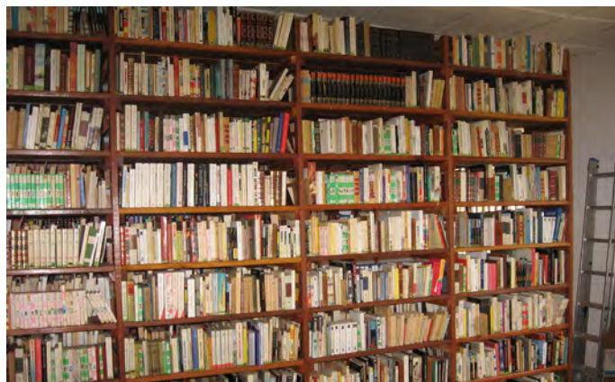
juillet-août 2013 : catalogage et rangement des livres