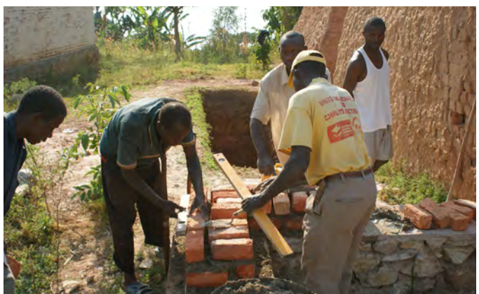
Juillet 2009, pose des premières briques